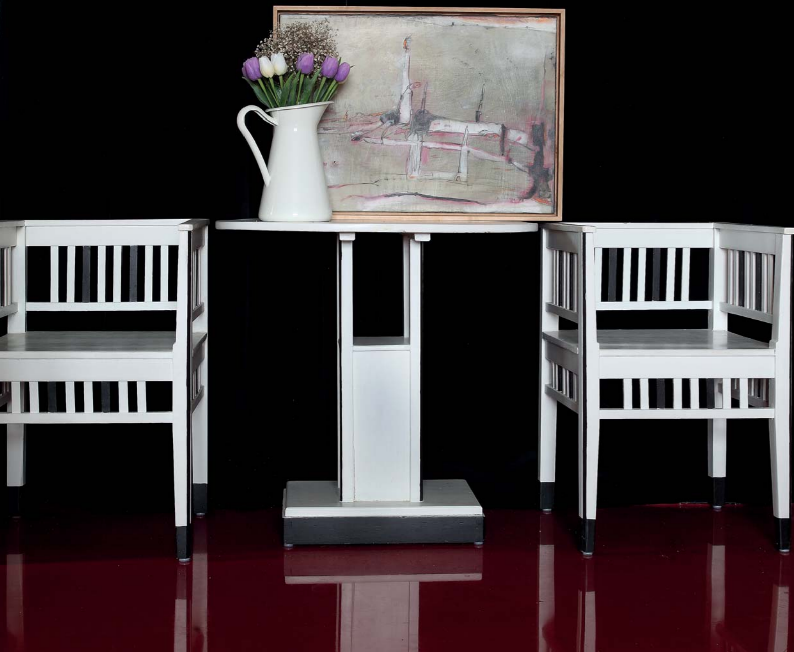
Osamělé domy z předměstí. Malby vznikly v letech 2004-5. Škoda, že většinu prvotin, na kterých se autor inspiroval pražskými Holešovicemi, sám později zničil.